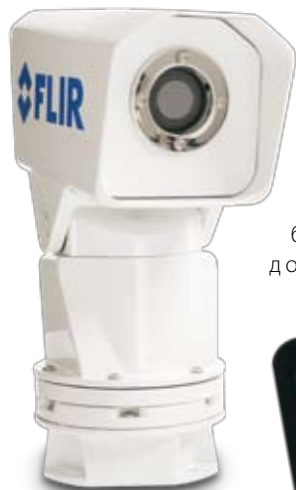
Камера FLIR Systems Navigator с наклоном/поворотом управляется пультом управления с джойстиком, который входит в комплект поставки любой камеры. Для управления камерой специальная подготовка не требуется.

автоматически вернуть камеру Voyager в заданное положение. Как опция могут быть предоставлены дополнительные