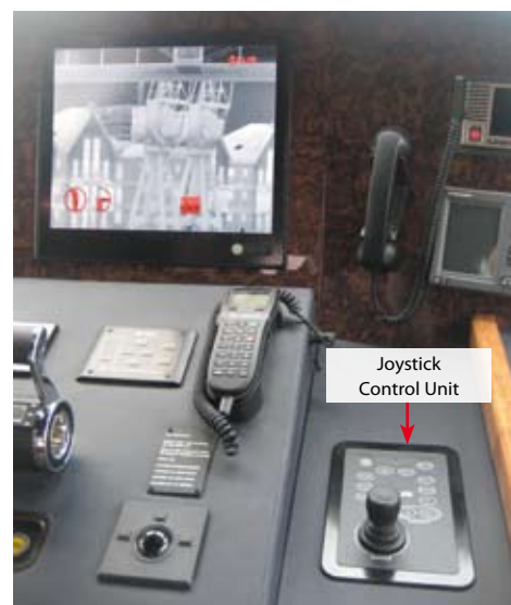
Joystick Control Unit

Через всю историю Sunseeker прослеживается одна ведущая черта: постоянные инновации в дизайне, технических характеристиках продукта, комфортабельности судна или технологиях.