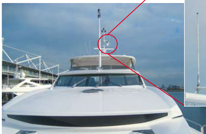
Та же 34-метровая яхта на судоходной выставке в Лондоне. FLIR Systems Voyager устанавливается на верхней части мачты.