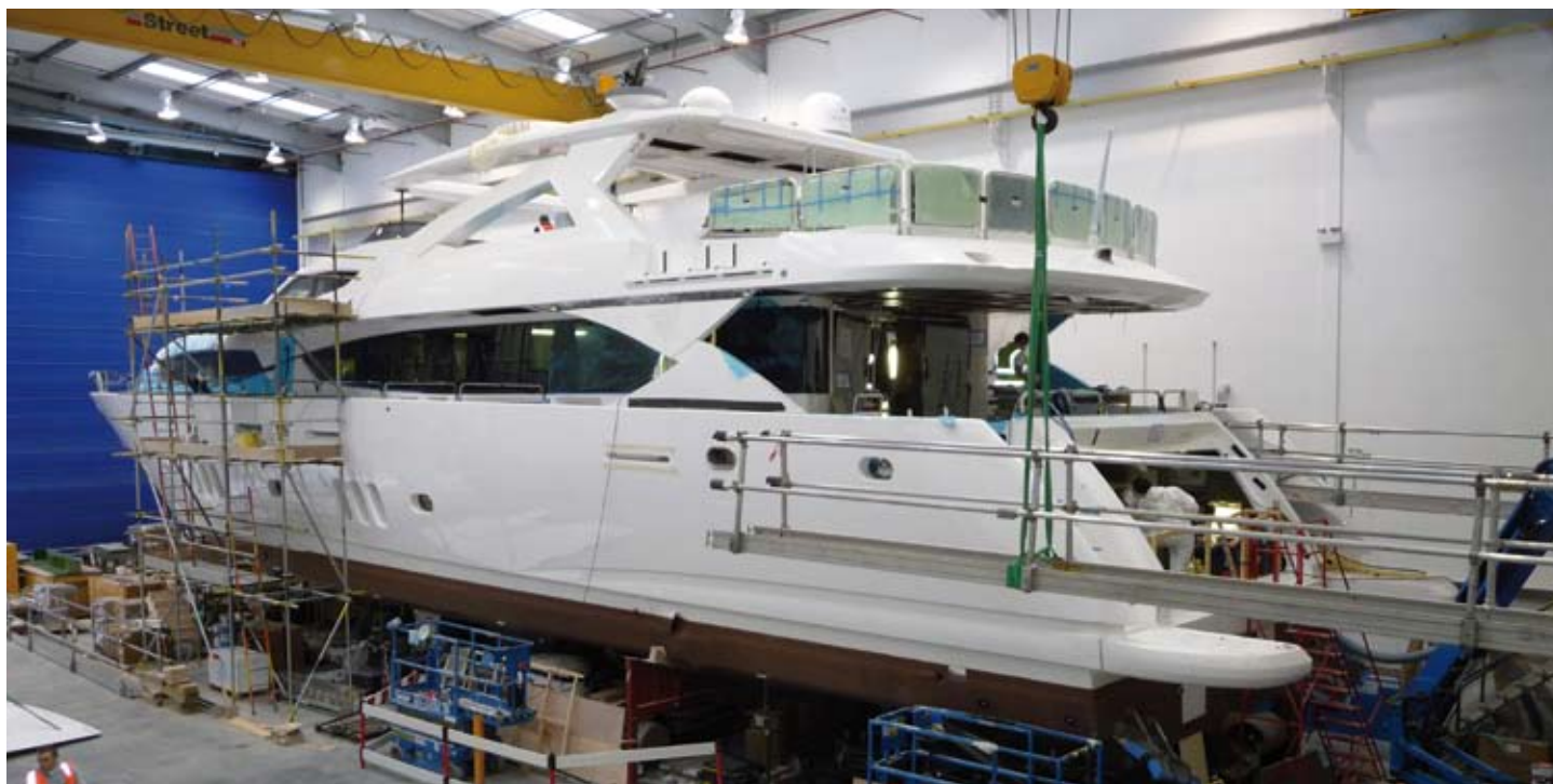
Строительство 34-метровой яхты в г. Пул, Англия