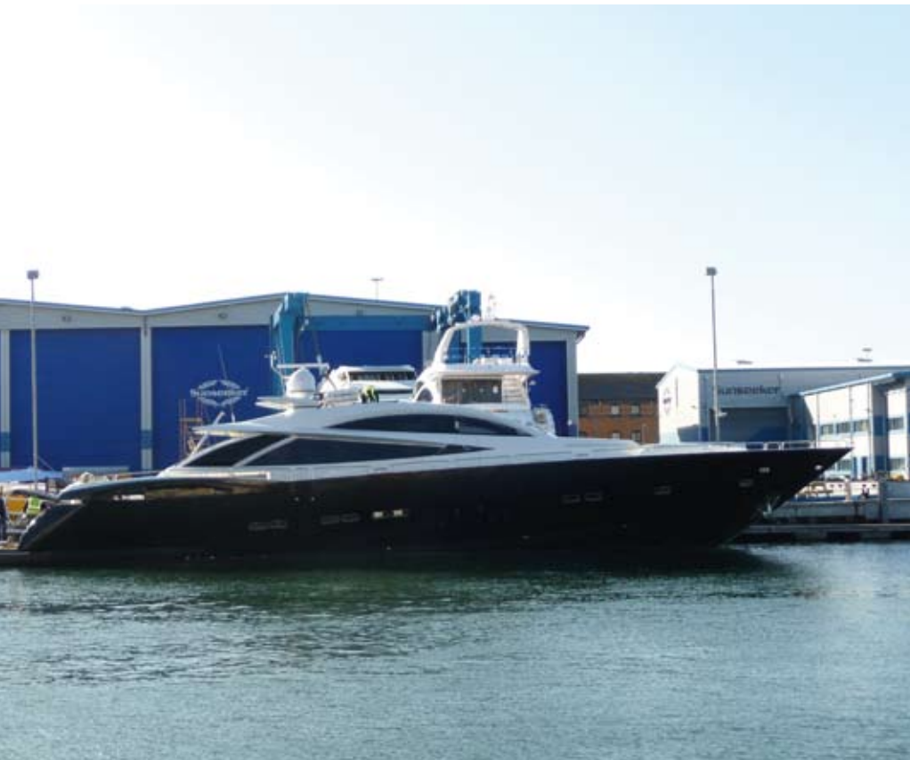
Sunseeker 108 Predator.

тепловизионная камера, которая устанавливается на борту судов Sunseeker, - поясняет Пол Риз.