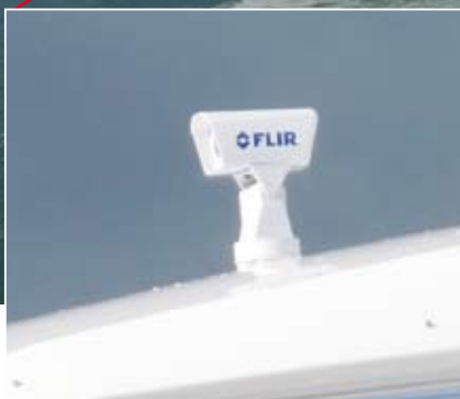
Яхта Flybridge с установленной на борту системой FLIR Systems Navigator

пульты управления для системы Voyager с четырех различных рабочих мест».