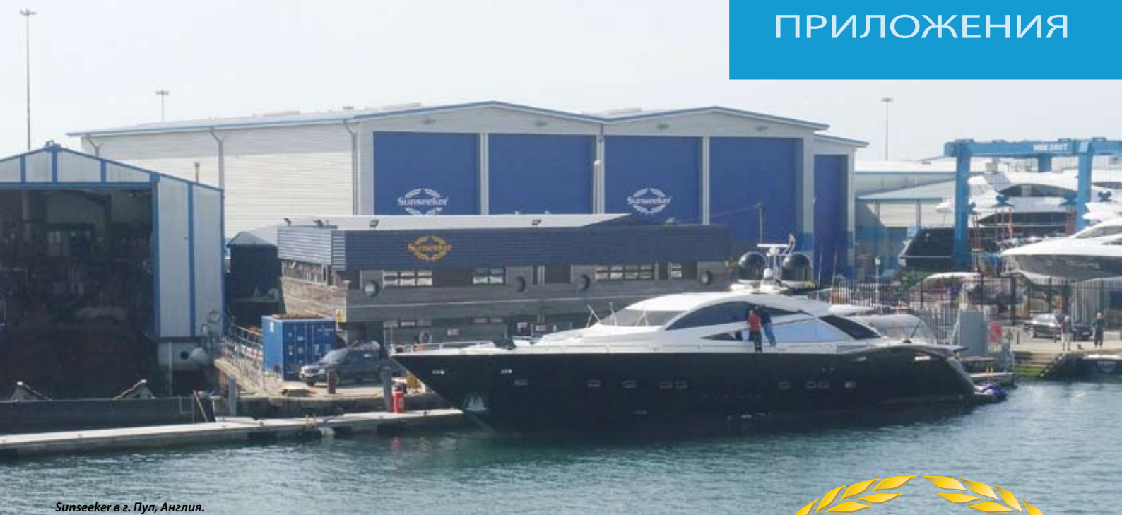
Sunseeker в г. Пул, Англия.