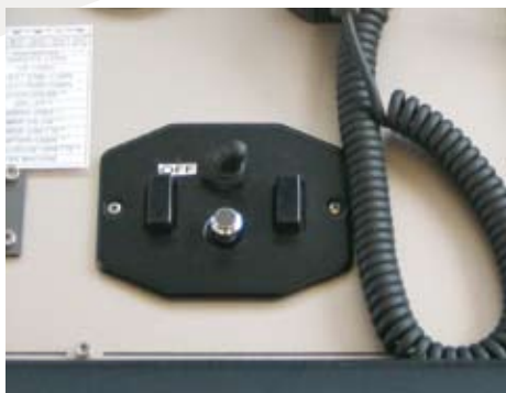
Джойстик управления (JCU)