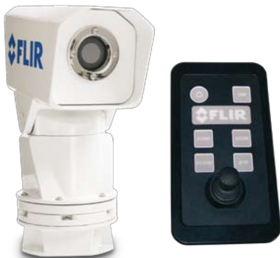
Новая камера FLIR Systems Navigator Pan/Tilt идет в комплекте с интуитивным джойстиком, с помощью которого обеспечивается быстрый доступ к функциям камеры.

наклоняться и поворачиваться, поэтому смотреть можно практически в любом направлении. Управлять джойстиком очень легко. Однако не хватает указателя на экране, в какую сторону смотрит камера. Важно знать, куда я смотрю – вперед или вбок. Можно ли как-то решить этот вопрос?», - критикует г-н Ферретти.