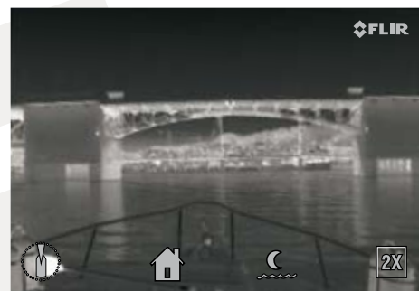
Благодаря маленьким значкам, удобно расположенным в нижней части термального изображения, капитан может сразу увидеть, в какую сторону обращена камера Navigator, и находится ли она в исходном положении. Все остальные настройки камеры также можно легко прочитать по этим значкам.