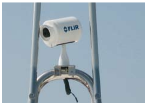
FLIR Systems Mariner

«Когда вы часто пользуетесь своей яхтой ночью, или если вы выходите в море рано утром до рассвета или возвращаетесь в гавань после наступления темноты,