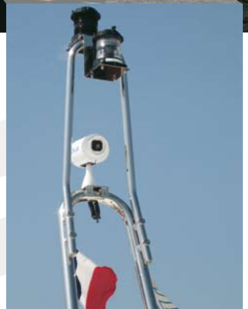
Тепловизионная камера FLIR Systems Mariner, установленная на борту яхты «Ziavanaia»

открытые круизные яхты, от 11 до 35 метров), Itama Cantieri Navali S.p.A (открытые моторные яхты, от 13 до 25 метров), the American Bertram Yacht, Inc. (спортивные