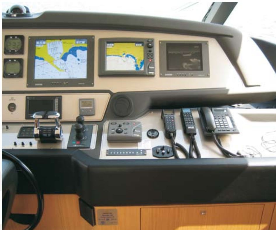
Джойстик контроля тепловизионной камеры FLIR Systems и ЖК-экран, показывающий термальные изображения, эстетично встроены в мостик

«Тепловизионная камера FLIR Systems устанавливается таким образом, что может