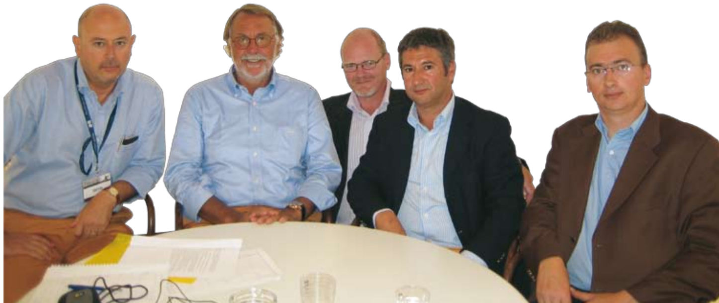
Слева направо: Г-н Амадуччи, специалист по закупкам навигационной электроники и консультант Ferretti Group – г-н Ферретти, Председатель Ferretti Group – г-н Гроненбум, Менеджер по развитию бизнеса FLIR Systems Products EMEA – г-н Ферничелли, Генеральный управляющий New Technology, дистрибьютор навигационной продукции FLIR Systems в Италии – г-н Марас, Менеджер по маркетингу FLIR Systems, Евразия